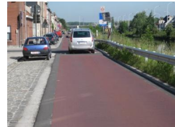
Motorvoertuigen max. 30 km/u