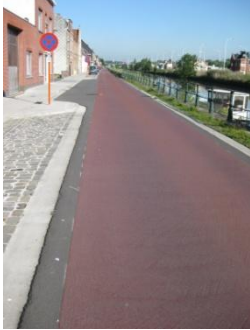
Afgewerkte fietsstraat in RAL-kleur 3009