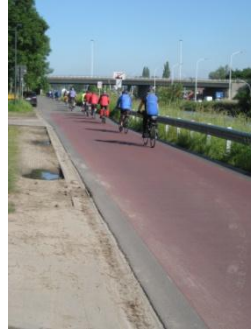
Fietsers mogen de hele breedte benutten