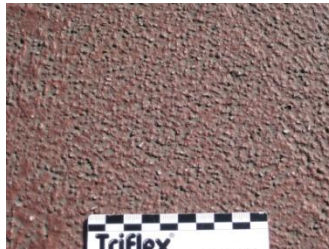
Stroef oppervlak met hoge SRT waarde