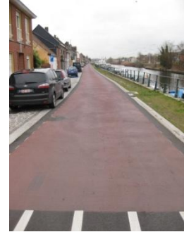
Begin van de fietsstraat