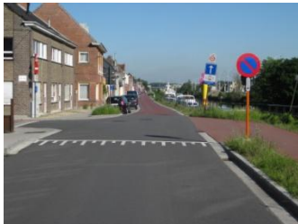
Overgang gescheiden fietspad -fietsstraat