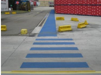
Zebrapad in huiskleur Alken-Maes