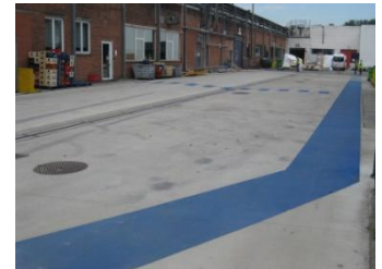
Duurzaam, kleurvast en voldoende stroefheid