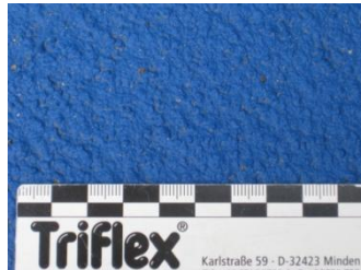
Hoge stroefheid min. 55 SRT