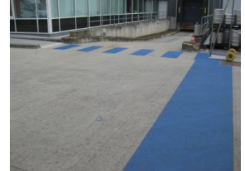
Looptrajecten die veiligheid bieden