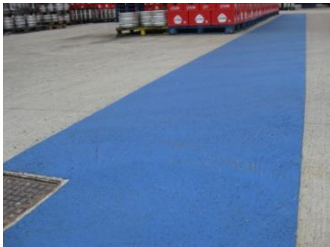
Afwerking met Reibeplastik 2K, RAL 5017, verkeersblauw