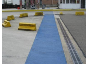
Looppad voor voetgangers