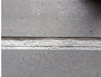
Situatie van de voegen voor aanvang van de werken.