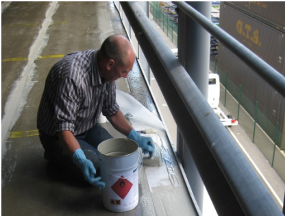
Plaatsen van de Triflex ProDetail.