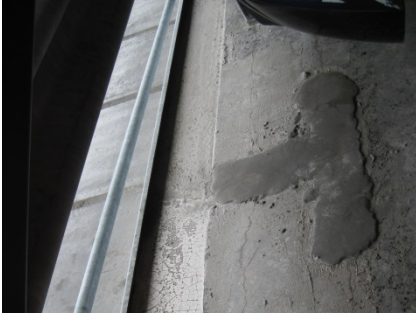
Situatie voor aanvang van de werken.