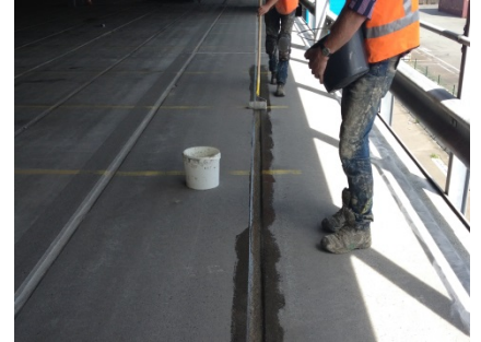
De voegen worden uitgevlakt met een sneldrogende mortel.