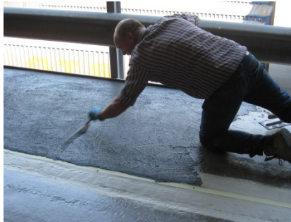
Plaatsen van de Preco Cryl Reibeplastik 2K.