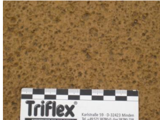
Stroef oppervlak met een hoge SRT-waarde