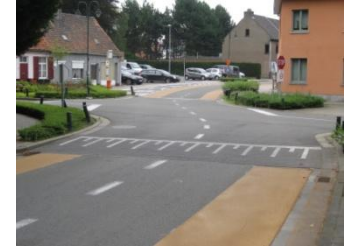
Door de korte uitvoeringsperiode bleef de verkeershinder in het centrum beperkt.