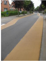
Optische versmalling waardoor het autoverkeer vertraagt.