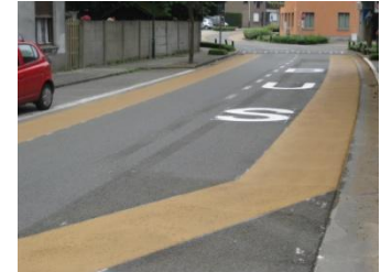
Geschrinkt parkeren waardoor de rijaslijn meermaals verlegd wordt.