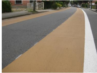
Door de fietssuggestiestroken komt de fietser duidelijker in beeld.