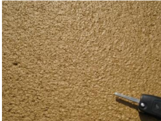
Stroef oppervlak met hoge SRT waarde