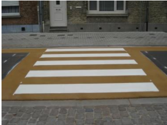
Oversteekplaats in Preco Cryl Kaltplastik RP 2K wit