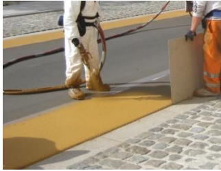
Aanbrengen van Preco Cryl Kaltplastik SP 3K, ral 1011 oker