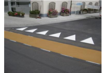
Fietssuggestiestrook en haaietanden