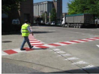
Een duidelijke markering op de site