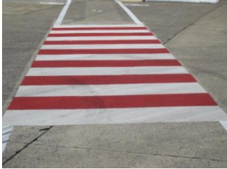
Afgewerkt zebra-pad met een duidelijke signaalfunctie