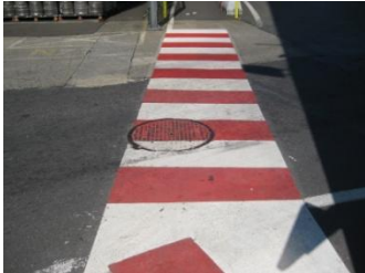
Reibplastik 2K in een witte kleur (RAL 9010) gecombineerd met rood (RAL 3020)