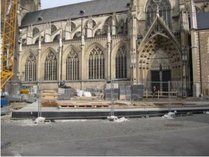
Start van de werken