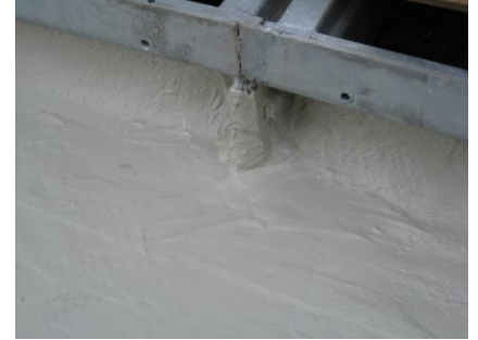
Afwerking van de details