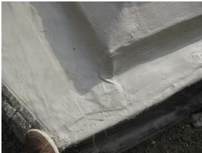
Afwerking van de hoeken