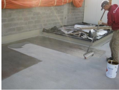
Aanbrengen van de Triflex primer