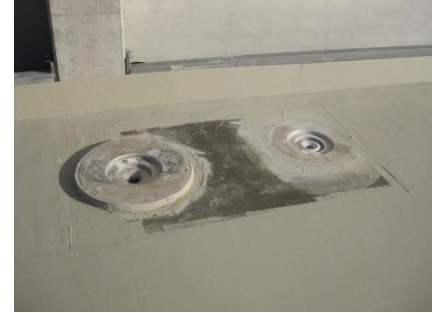
De hemelwaterafvoer, noodoverloop en opstand worden waterdicht ingewerkt.