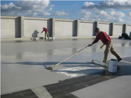
Het volledig gewapend en scheuroverbruggend membraan wordt aangebracht.