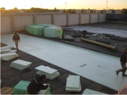
Het plaatsen van het geïsoleerde systeem.