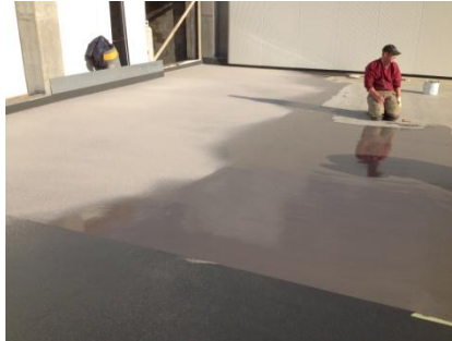
De berijdbare slijtlaag wordt aangebracht. Deze wordt onmiddellijk vol en zat ingestrooid met vuurgedroogd kwartszand.