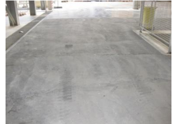
Afgewerkte vloer van de productiehal