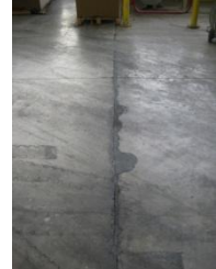
De voegen werden hersteld