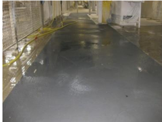
Voldoende antislip, ook in natte omstandigheden