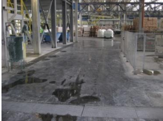
Situatie voor aanvang van de werken