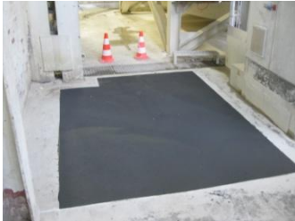
Afwerking met Reibeplastik 2K, RAL 7043, verkeersgrijs