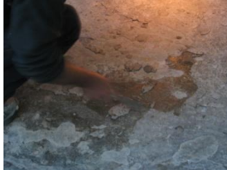
Verwijderen van de silicaatkoek