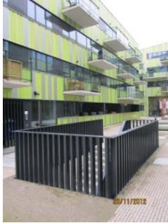
Kop van Kessel-Lo: een levendige stadswijk, nabij het centraal station