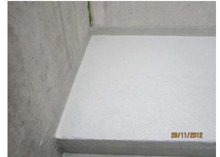
Overgang vloerveld naar muuraansluiting