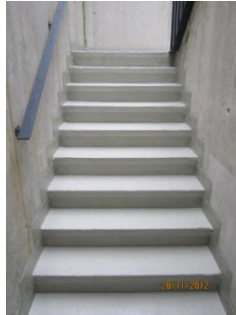
De trap werd afgewerkt met het Triflex BTS-P systeem