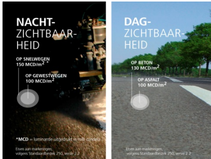
Nachtzichtbaarheid en dagzichtbaarheid.