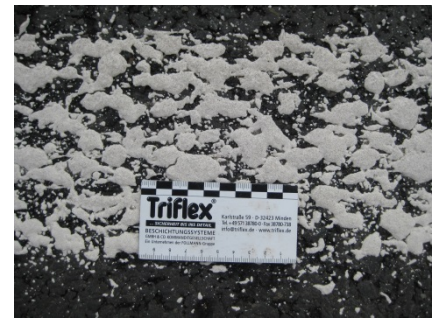
Structuur van de agglomeraatmarkering.