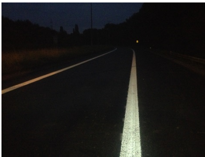
Verbeterde nachtzichtbaarheid en dus ook verhoogde veiligheid op de autosnelweg.