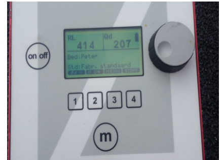
Waardes van de dag- en nachtzichtbaarheid.