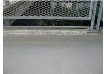
Afwerking aan de opstand