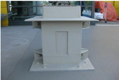
Afwerking van de details