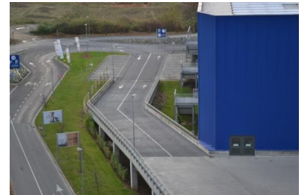
Afgewerkte hellingbaan met Triflex PDS-R systeem