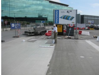
Plaatsen van het gewapend waterdichtingsmembraan