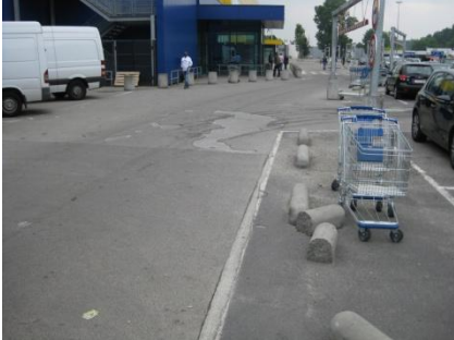
Situatie voor renovatie