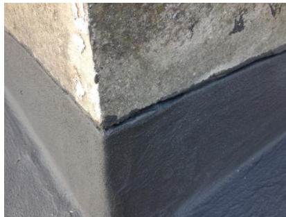
Afwerking van de opstanden rondom het parkeerdak