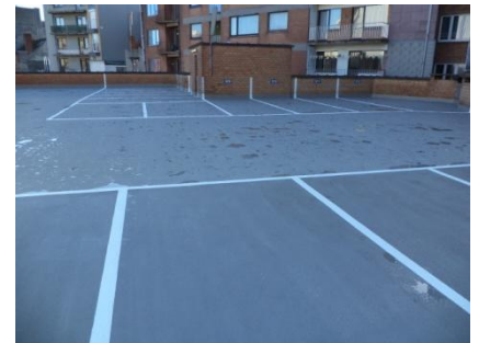
Afgevoerd project met het Triflex ProPark variant 1 systeem