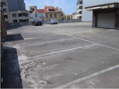
Situatie voor de renovatie