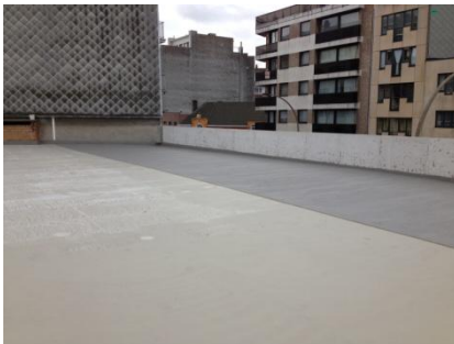
De afwerkingslaag wordt geplaatst op de waterdichting