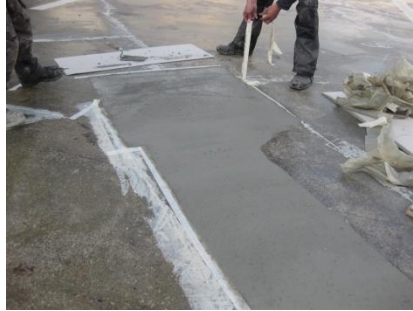
Beton herstellen met Triflex Cryl RS 240