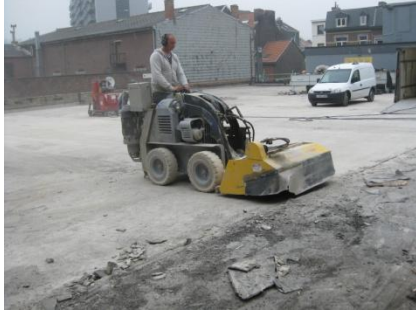
Bestaande draagconstructie na het verwijderen van het gietasfalt