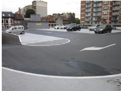
Parking met markeringen