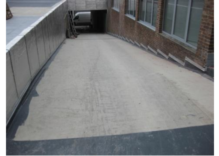
Nieuwe beton en detailafwerking inrit hellingbaan