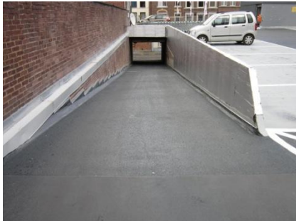
Uitrit hellingbaan afgewerkt met het Triflex PDS-R systeem