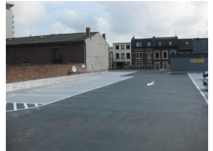
Afgewerkte parking met het Triflex PDS-T systeem