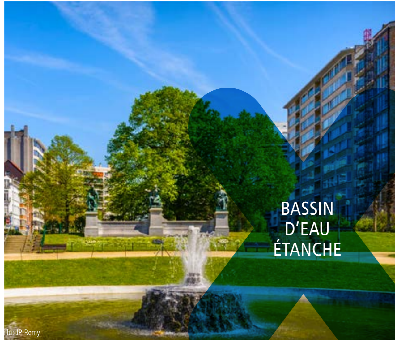
Illu: JP Remy